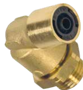
515 SWIVEL STUD